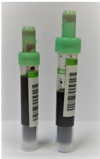
Abbildung 2: korrekt befüllte und beklebte Citrat-Monovetten (alt links, neu rechts).

Wir möchten Sie bitten, die Monovetten nur bis zu der entsprechenden Markierung zu füllen (siehe Abbildung 1). Bei korrekter Handhabung ist eine Befüllung der Monovette über die Markierung hinaus nicht möglich . Ein Auffüllen der Monovette mit einer zweiten Probe ist NICHT empfohlen und kann zu falschen Ergebnissen führen. Ebenso sollte eine Unterfüllung der Monovette vermieden werden, da dies ebenfalls falsche Ergebnisse zur Folge haben könnte.